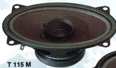
T 115 M

Il T545 ha terminali che permettono il collegamento ad un sistema biamplificato.