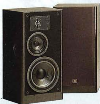
LX - 66