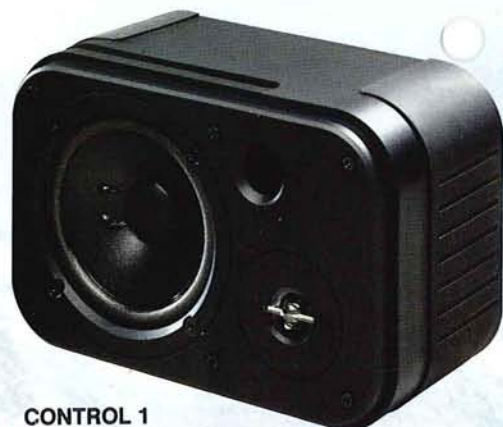
CONTROL 1 Monitors da banco di regia